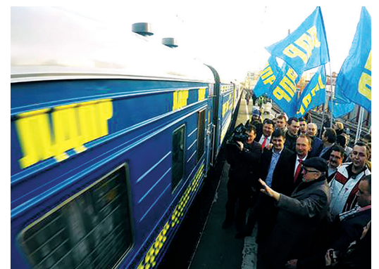
График движения спецпоезда ЛДПР по Владимирской области можно посмотреть на последней странице.

ПОЖАЛУЙСТА, СОХРАНИТЕ ГАЗЕТУ – ПЕРЕДАЙТЕ ЕЁ ДРУГИМ!