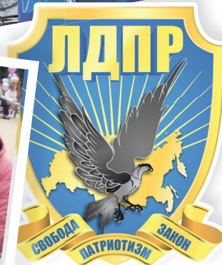
ГРАФИК РАБОТЫ ОБЩЕСТВЕННЫХ ПРИЁМНЫХ МЕСТНЫХ ОТДЕЛЕНИЙ ЛДПР

ВЛАДИМИРСКОЕ РЕГИОНАЛЬНОЕ ОТДЕЛЕНИЕ, +7 (4922) 35-39-80.